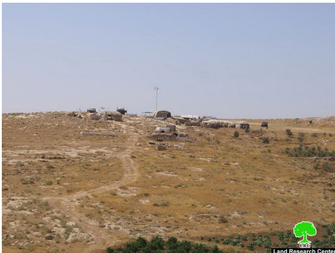
הצור 1-2: אחרר רמ 14830 ואלל יפצלי בהמ 6 מנשאל סכניה וזראעה