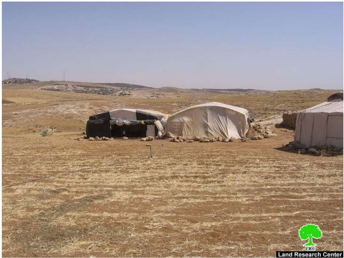
الصور 3-5 : جانب من المنشآت المهددة بالهدم حسب الاخطار رقم 14830 / واد جحيش